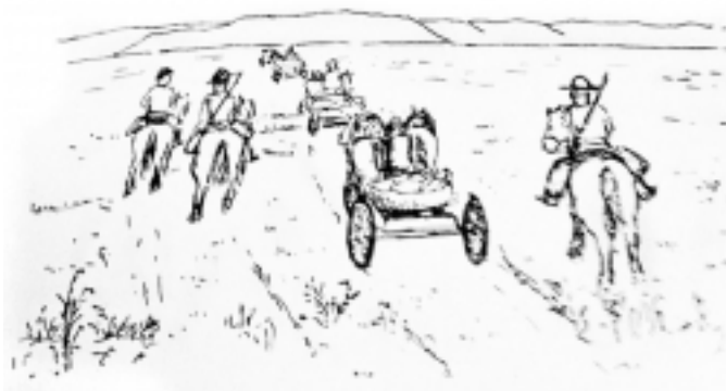
På Minusinska stäppen.